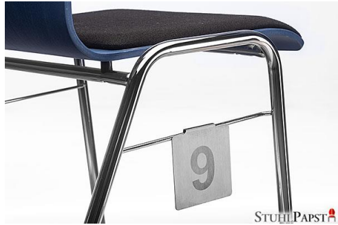
HAR.MONIE Platznummern Schild