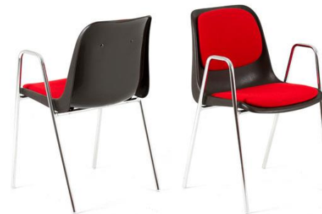
MILANO de Lux AL