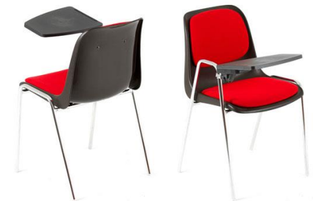
MILANO de Lux CO