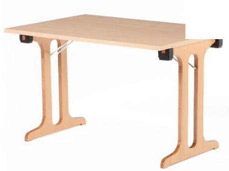
COM.FORT de Lux Tisch