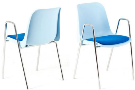
MILANO SI AL