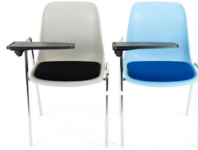
MILANO SI CO